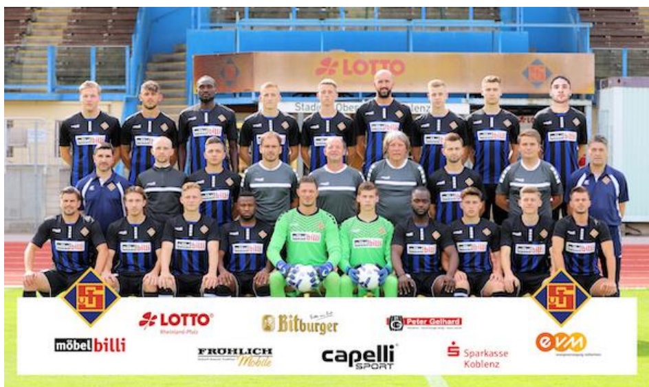
Mannschaftsfoto TuS Koblenz aus der Saison 2019/20

Was für ein tolles Los für die Spvgg Cochem in der 1. Runde des Bitburger Rheinlandpokal. Mit der TuS aus Koblenz hat man einen ambitionierten Oberligisten im Moselstadion zu Gast, der natürlich als klarer Favorit in diese Begegnung gehen wird. Die Mannschaft aus der „Schängel“ Stadt belegte in der abgebrochenen Saison Platz vier der Oberligatabelle. Das Ziel der Koblenzer ist sicherlich der Aufstieg in die Regionalliga, zumal Stadtrivale RW dort nun im zweiten Jahr antritt.